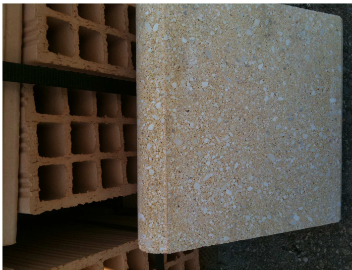
Fig. 2 Mattoni in pasta di cemento con scaglie di marmo

Si precisa che per maggiore dettaglio della contabilizzazione effettuata per detto intervento si allega alla presente computo metrico dettagliato delle opere da effettuarsi nonché planimetria dettagliata illustrativa della tipologia di intervento di che trattasi.